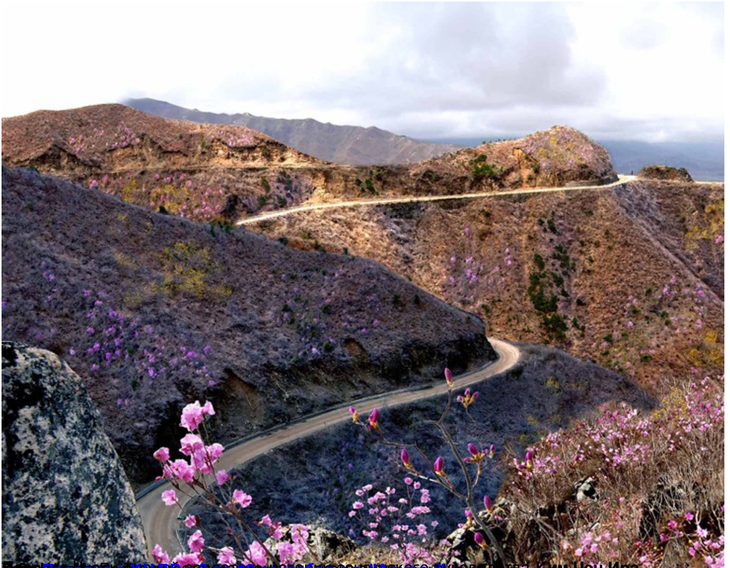
Корейский фильм "Ким Ир Сен" до 10 сентября 1950 года. Руководства Ким Чен Ира.

06.05.2011 12:41 - Обновлено 09.06.2013 10:40