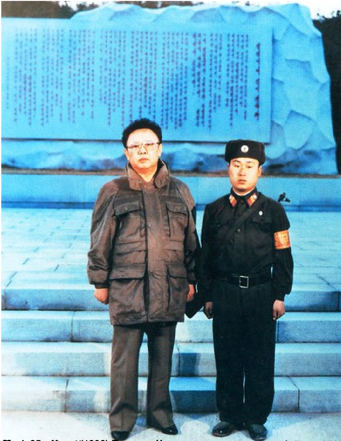
Мэр Ода Юнги (1996) сфотографировался на память с бойцом КНА Пак Гван

06.05.2011 12:41 - Обновлено 09.06.2013 10:40