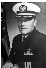
Капитан "Пуэбло" Lloyd Mark Bucher